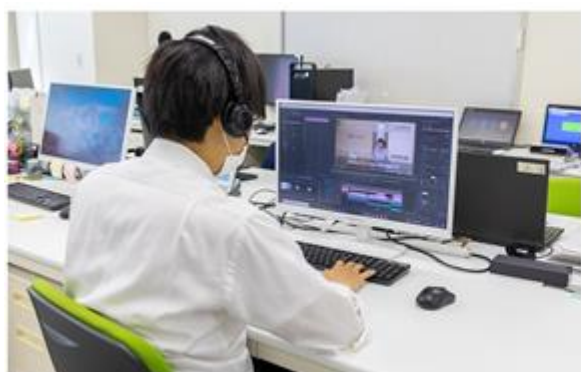
専用ソフトを使用した動画編集作業

DTSパレットでは社員が安心して働けることを最優先とし、職場環境の改善を常に行っています。例えば、仕事を受注する際には、個々人の能力に応じて時間的余裕をもたせた納期調整を行う体制をしいています。また、通院休暇制度を設けると共に、社員の自主的な体調管理を促しています。2018年には下肢に障がいのある社員が末永く働けるようテレワークを導入しました。職場にはカメラやZoomやTeamsなどのコミュニケーションツールを使用し、リモート勤務でも会社の様子が伝わるよう配慮しています。2020年には障がい者生活相談員による月1回の定期ヒアリングに加え、電話による相談窓口を開設し、社員からの相談体制を強化しています。