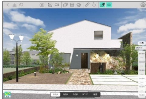
Walk in home 360x 画面イメージ (左: 計測機能、右: 日照シミュレーション)