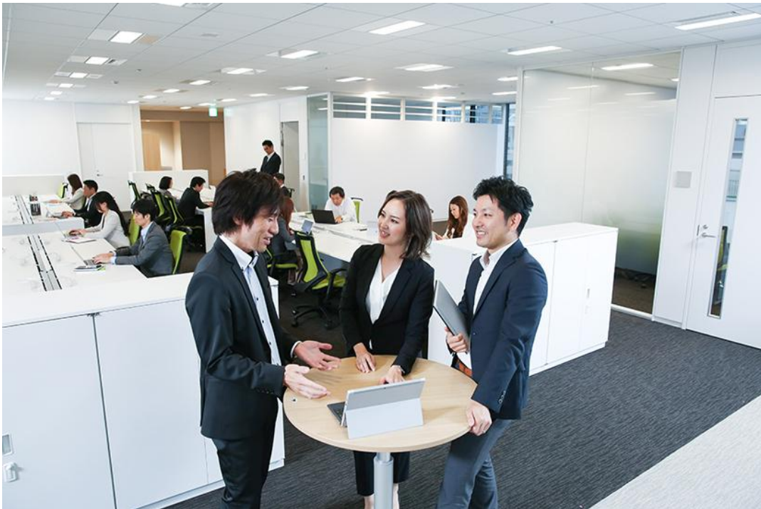
執務エリア:窓際に簡易的な打ち合わせスペースを設置。社員のコミュニケーションを活性化させ、業務の効率化を狙う。