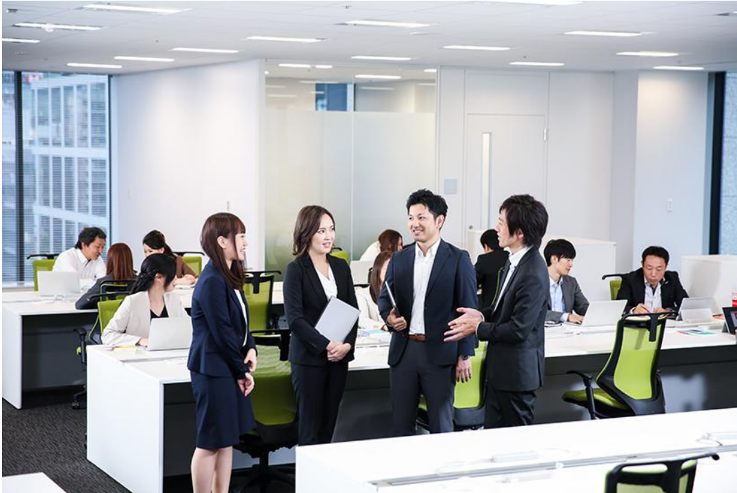
執務エリア:エンパイヤビルの6階から9階までのフロアで勤務。